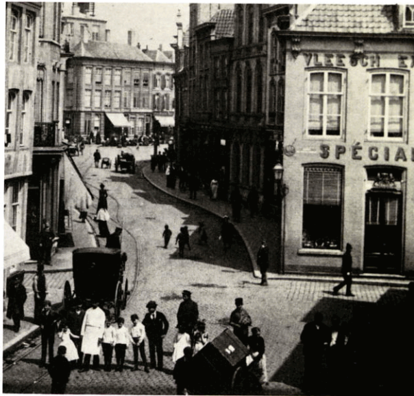
Schapenmarkt met op de achtergrond de Markt. Gedurende enige jaren was Boekhandel Mosmans in een van de panden van het 'bouwblok' gevestigd.

In 1870 verschijnt bij Mosmans een feestmars van Johan Eggers, de toenmalige organist van