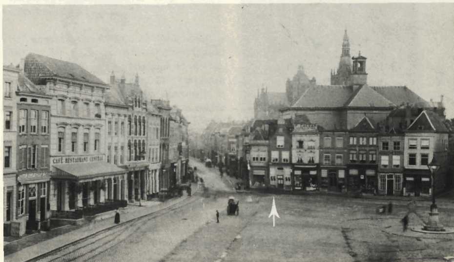
De Bossche Markt \pm 1900. Vanaf 1873 was de boekhandel Mosmans gevestigd in het pand Markt 27.