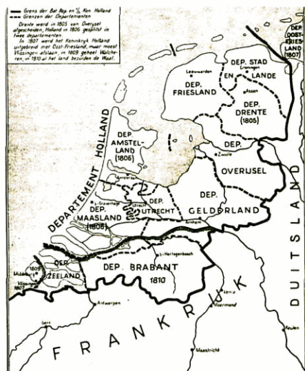
De Bataafse Republiek en het Koninkrijk Holland 1801-1810, met het Departement Brabant.