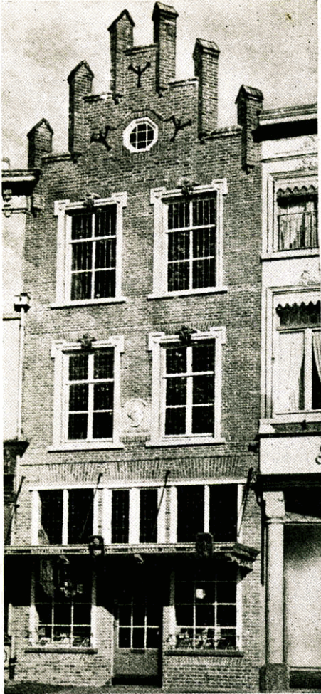
In 1902 werd de boekhandel overgenomen door van Gent en d'Herripon. Het winkelpand Markt 27 werd in 1948 verbouwd door H.W. Valk, architect.

Swagerman begon in die dagen ook met uitgaven van bladmuziek. Muziekhandel Spiero was al in de jaren twintig met het uitgeven van bladmuziek begonnen. Daarbij waren ook carnavalsmarsen en potpourri's van bekende melodieën. De gloriejijd van muziekhandel Mosmans was toen al voorbij. Toch bleef de winkel gehandhaafd tot de dood van de oudste van de drie broers.