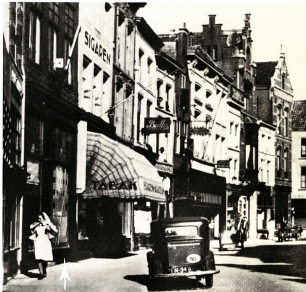
Kerkstraat. In het winkelpand achter de verpleegster was de Muziekhandel Mosmans vanaf 1915 gevestigd. (foto ±1930)