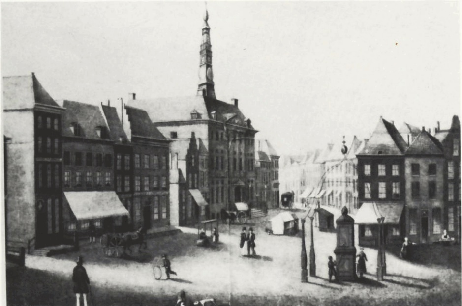
De Bosche Markt ±1820.

Van Gulpen, die de naam van zijn krant inmiddels in Bataavs-Brabandsche-Bossche Courant had veranderd, zond op 21 september 1796 een rekest naar de Bossche municipali-