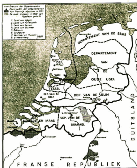
De Bataafse Republiek, 1795-1801, met het Departement van de Dommel.